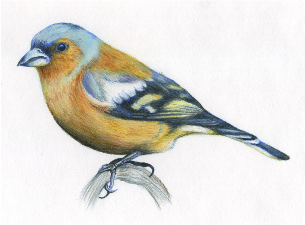
Buchfink. Illustration: Thomas Hättenschwiler