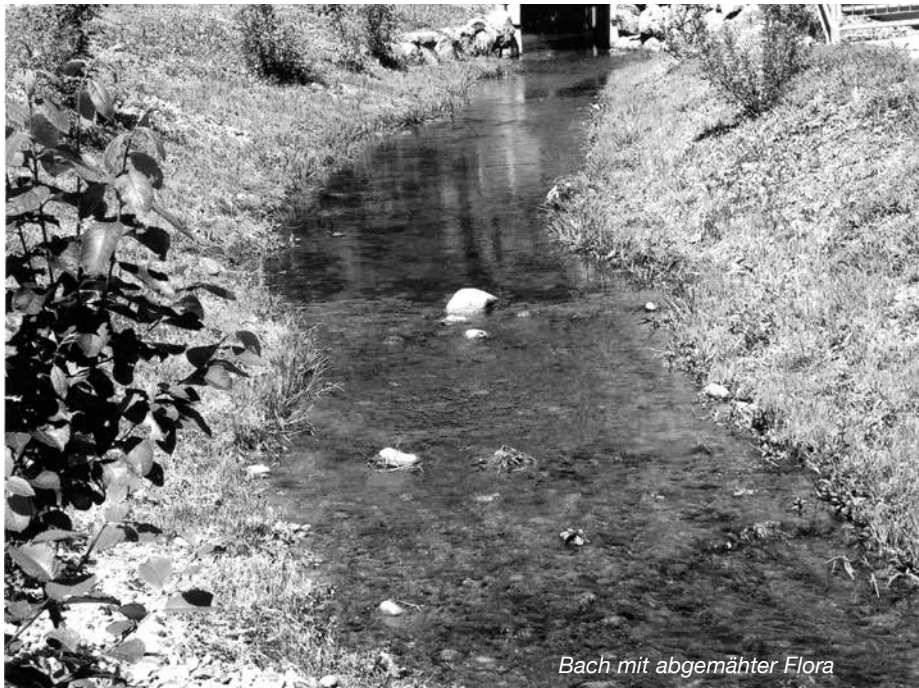
Bach mit abgemähter Flora

der FLAWA-Verbandstofffabrik innert kurzer Zeit die ganze Pracht razekal abgemäht hat. Ich habe umgehend telefonisch bei der FLAWA dagegen protestiert. Man zeigte dort Verständnis für meinen Ärger und versicherte mit, dass so etwas nie mehr passieren werde. Ein Trost, aber nur ein kleiner. Für dieses Jahr ist die Blumenpracht vorbei. Ich frage mich, wie so etwas heute noch geschehen kann. Aber eben, gegen Dummheit kämpfen Götter selbst vergeblich.