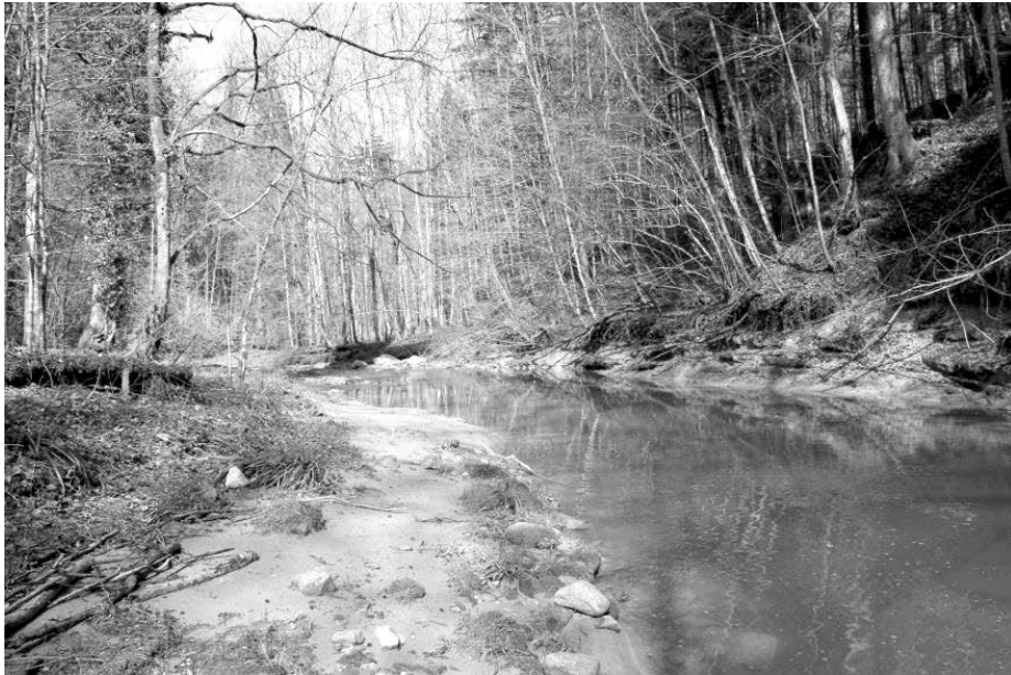
Steinach im mittleren Abschnitt, diese Idylle würde vernichtet.

Die Steinach fliesst ab der Lukasmühle offen und unverfälscht bis zur Einmündung in den Bodensee in Obersteinach. Bis im Juni 2014 haben die ‚gereinigten‘ Abwasser der ARA Hofen in Wittenbach das Gewässer in einen stinkenden Bach verwandelt. Sogar die Fische haben den üblen Geruch angenommen. Das ist zum Glück heute nicht mehr der Fall. Aus der Presse konnten wir kürzlich entnehmen, dass sich das Gewässer wieder mit Leben füllt, seit sich dank der separaten Führung des gereinigten Schmutzwassers in den Bodensee die Wasserqualität stark verbessert hat. Es wurden erstmals Steinfliegenlarven in der Steinach entdeckt, welche nur in sauberem Wasser überleben können. Das Flüsschen ist neben dem Alpenrhein der wichtigste Laichplatz für Seeforellen am Bodensee. Jährlich steigen 350 bis 550 dieser grossen Fische stromaufwärts zu den Laichplätzen.