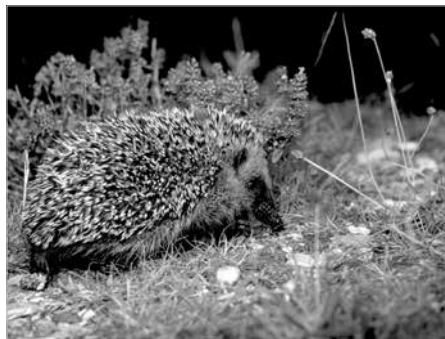
Igel; ist ihre Zahl rückläufig?

Die Website stadtwildtiere.ch informiert nicht nur über die Biologie der Säugetiere und von Mauer- und Alpenseglern, sondern gibt auch Tipps, wo sie sich am ehesten beobachten lassen und was gegebenenfalls zu ihrer Förderung unternommen werden kann.